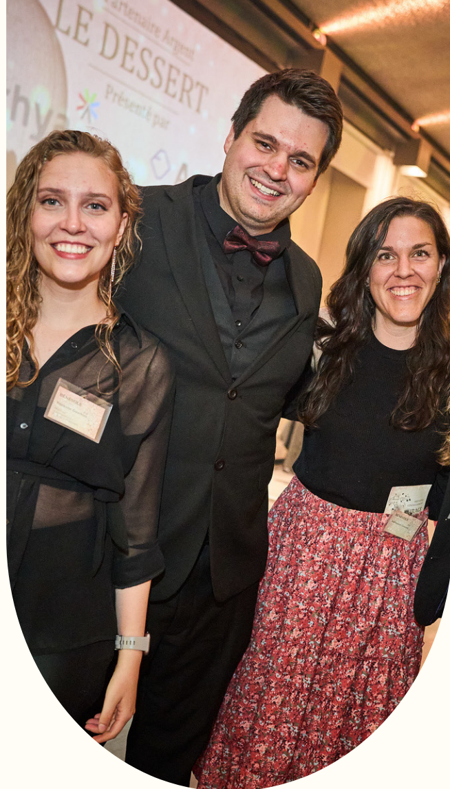
Nos boursiers s'impliquent comme bénévoles lors de nos événements !